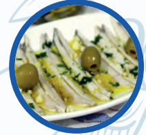
Boquerones en vinagre