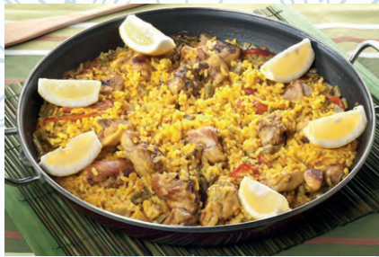
Paella de Pollo / Chicken