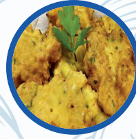
Buñuelos caseros de Bacalao o langostinos

Buñuelos caseros de Bacalao o langostinos Cod and prawns fritters 2,50€/ Unid