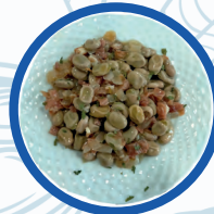
Habitas con Jamón