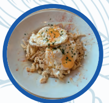
Gambas de Krystal y huevos fritos

Gambas de Krystal y huevos fritos Glass prawns with eggs 11,90€