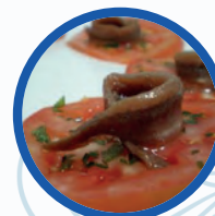
Anchoas sobre tomate