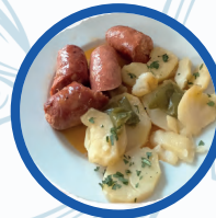
Chorizo al vino fino