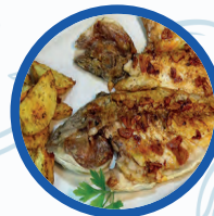
Dorada a la espalda

Dorada a la espalda / Grilled bream 18,00€