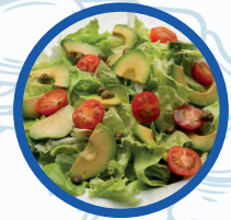
Ensalada de aguacate