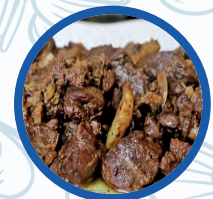
Costilla de cerdo con salsa barbacoa