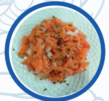
Ensalada Casa Flores