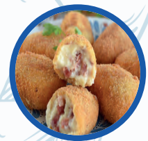
Croquetas caseras de jamón, cocido, Rabo de toro y bacalao

Croquetas caseras de jamón, cocido, Rabo de toro y bacalao Croquettes hand made of Ham, cooked, bull's tail or bacalao 5,00€ (1/2 rac.) 10,00€