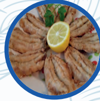
Boquerones al limón

Boquerones al limón / Fried anchovies with lemon 9,00€