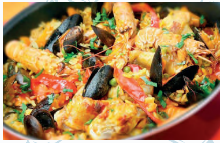
Paella Marisco / Seafood