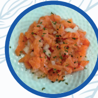
Ensalada Casa Flores