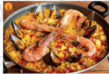
Paella Mixta / Mixed