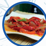
Ensalada de Pimientos del piquillo