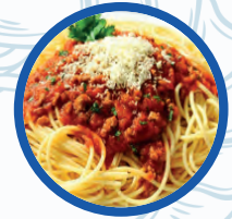
Macarrones ó espaguetis a la Boloñesa

Lagrimitas de pollo con patatas fritas 8,90€ Chicken Fingers with frite potatoes