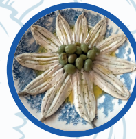
Boquerones en Vinagre

Boquerones en Vinagre / Anchovies in vinegar 4,90€ (1/2 rac.) 8,90€