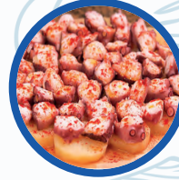
Pulpo a la Gallega

Pulpo a la Gallega / Galician Octopus 15,00€