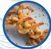
Pincho de gambas