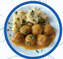
Albondigas en salsa de Almendras