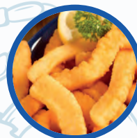
Rabas de Calamar