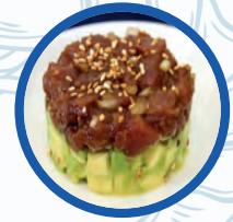
Tartar de Atún rojo fresco

Tartar de Atún rojo fresco / Tartare handmade with fresh tuna 13,00€