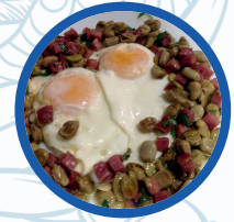
Habitas saltadas con jamón iberico y huevos

Habitas saltadas con jamón iberico y huevos Homade de broad beans with ham and eggs 10,00€