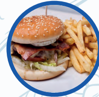
Hamburguesa completa con patatas fritas

Hamburguesa completa con patatas fritas 9,00€ Burger full with frite potatoes