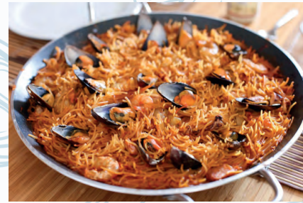
Fideua de Marisco / Seafood

Hechas en 25 Minutos aproximadamente (Minimo para 2 personas)