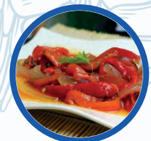
Ensalada de pimientos