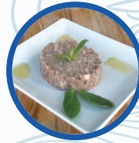
Tartar Casa Flores

Tartar Casa Flores (elaborado con Salchichón de Málaga) Tartare handmade With malaga sausag 11,00€