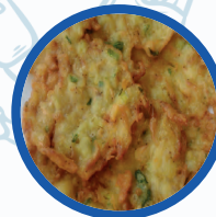
Tortitas de Camarones

Tortitas de Camarones / Shrimp Pancakes 2,50€/ Unid