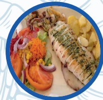
Calamar nacional XXL

Calamar nacional XXL / Special Grilled National Squid 35,00€