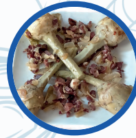
Alcachofas salteadas con jamon iberico y cebolla

Alcachofas salteadas con jamon iberico y cebolla Sauteed artichokes with ham and Onions 3,50€ Unid