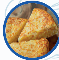
Tortila de Patatas

Sardinas Ahumadas / Smoked sardinas (unidad) 3,00€