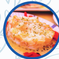
Ensalada Casa Flores