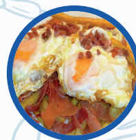
Huevos Rotos con Jamón, chistorra y patatas caseras

Huevos Rotos con Jamón, chistorra y patatas caseras Broken eggs Whith ham and chistorra 11,90€